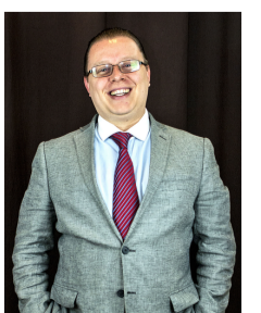
Imagen No verbal Verbal